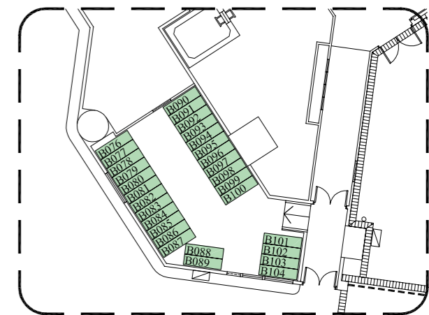
PART PLAN OF BICYCLE PARKING AREA 單車停車範圍部份平面圖