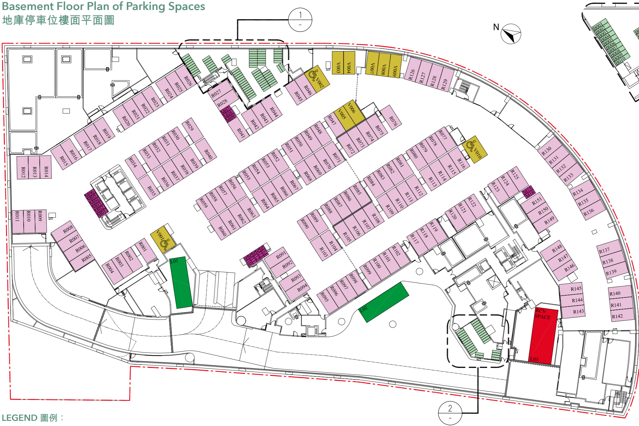
Basement Floor Plan of Parking Spaces 地庫停車位樓面平面圖